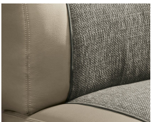
+ Bekleding Camino