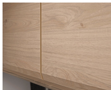
+ Meubeldecor Noce Nagano