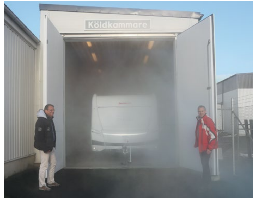
Het testteam van Dethleffs in Zweden