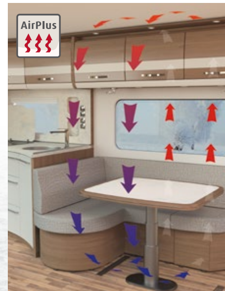
Het Airplus-systeem voorkomt de vorming van condenswater