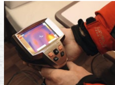
De temperaturen worden getest met een warmtebeeldcamera