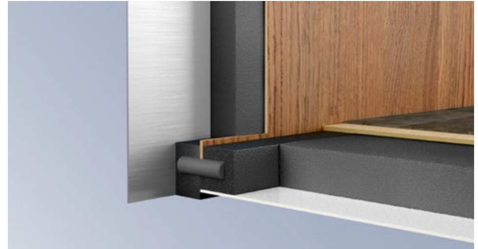
Goed geïsoleerd: wanddikte 34 mm, bodemdikte 42 mm

De Premium warmwaterverwarming zorgt voor een zeer aangename en gelijkmatige verdeling van de warmte in het hele voertuig. Deze werkt zonder aanjager en is daarom ideaal voor mensen met een allergie. Gecombineerd met de optionele vloerverwarming zorgt dit voor een een optimaal woonklimaat, ook voor mensen die graag op blote voeten lopen.