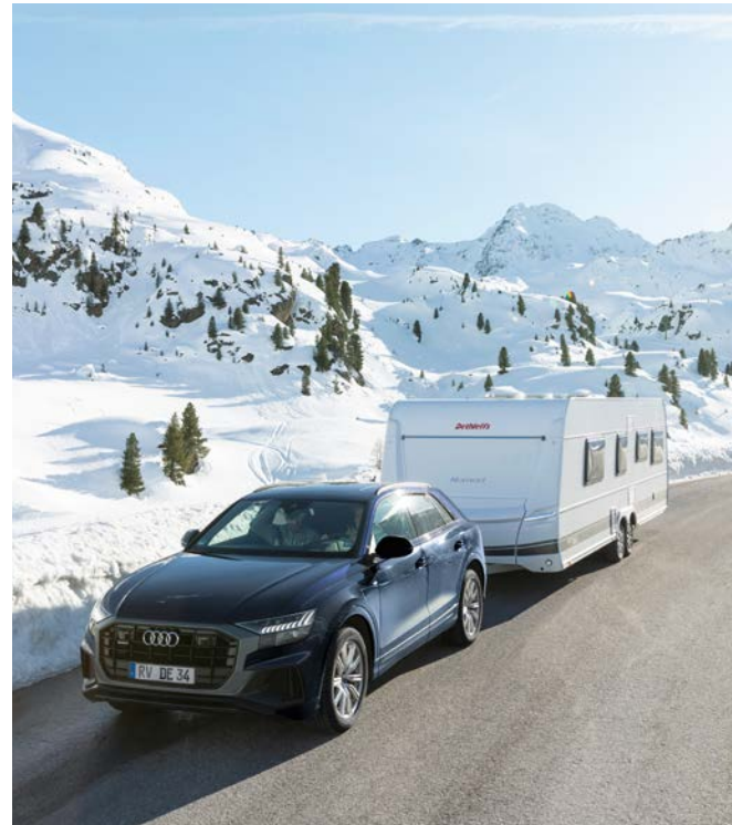
Turvallista talvimatkailua Dethleffsin talvimatkailuun varustellulla matkailuvaunulla.