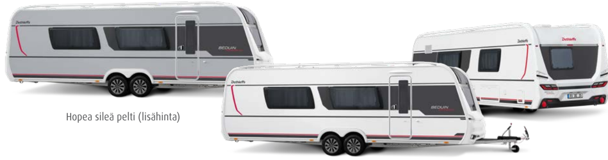
Hopea sileä pelti (lisähinta)