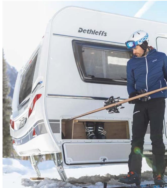
Loma-asunto aivan rinteiden vieressä, ja sisällä on yhtä lämmintä ja mukavaa kuin kotona.

Näiden pitkän kokemuksen perusteella kehitettyjen varusteiden ansiosta matkailuvaunu pysyy kotoisan lämpimänä myös kylminä pakkasöinä ja vesilaitteisto ei jäädy.