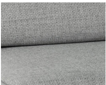
+ Bekleding Amposta