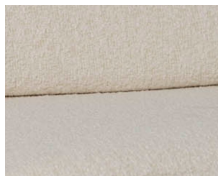
+ Bekleding Tropea