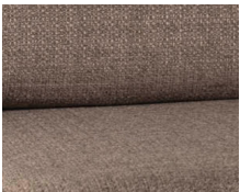
+ Bekleding Tarragona