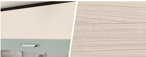
+ Tindari Bora