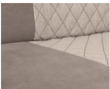
+ Bekleding Jupiter