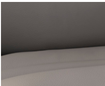
+ Echtlederen bekleding Collin ○