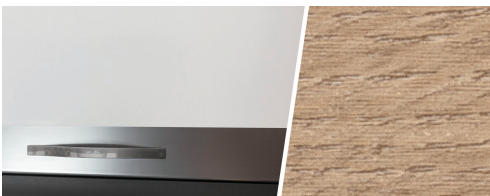
+ Meubeldecor Amberes Oak