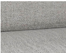
+ Bekleding Samir